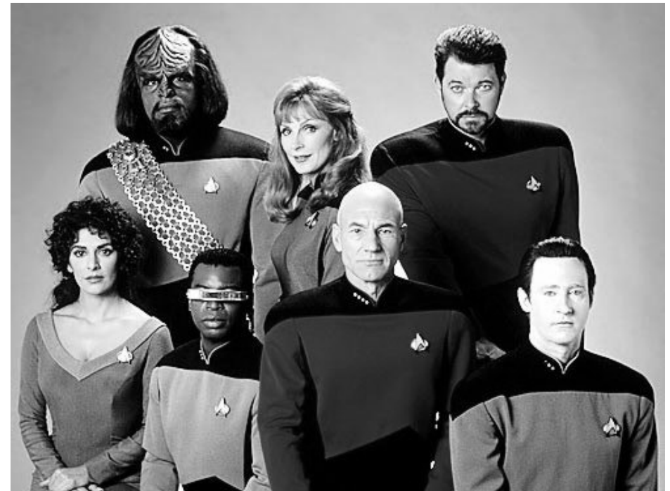
Ufficiali superiori della USS Enterprise in alto da sinistra: Tenente Worf, dott. Beverly Crusher, Comandante William T. Riker. in basso da sinistra: consigliere Deanna Troy, Tenente Geordi Laforge, Capitano Jean-Luc Picard, Tenente comandante Data (Cast di The Next Generation - 3° stagione)