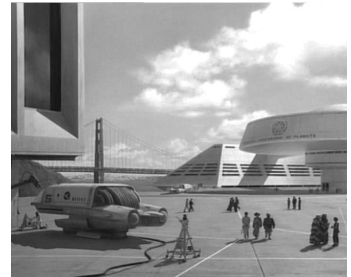
Sede della Federazione di San Francisco ( "Cospirazione" - The Next Generation - 1° stagione)

Parte fondamentale del progresso dell'umanità sono stati i rapporti con le altre specie. La