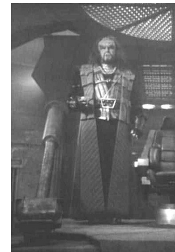
Un klingon a bordo di uno sparviero (" Questione d'onore " - The Next Generation - 2° stagione)

La conoscenza, l'autocontrollo e la forza rendono molti Vulcaniani in grado di applicare una particolare "presa", che si effettua stringendo tra le dita la parte della spalla vicina al collo di un umanoide. Costui, per effetto della presa, tipicamente sviene all'istante rimanendo incosciente per qualche minuto. La presa ha effetto su tutte le principali razze conosciute del ventitreesimo secolo.