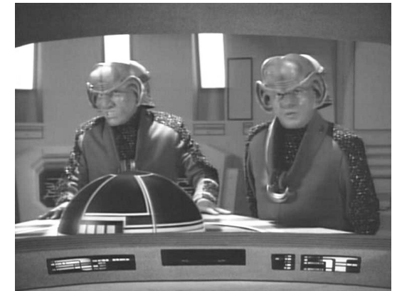
Due Ferengi sul ponte di comando ("Una strategia perfetta" - The Next Generation - 2° stagione)

I Borg non assimilano tutte le specie che incontrano, ma solamente quelle che possono apportare delle migliorie alla loro conoscenza. Non si sa molto dell'effettivo livello tecnologico dei Borg, tranne il fatto che è molto superiore rispetto a quello della federazione. Per esempio i vascelli Borg, tipicamente di forma cubica e giganteschi per gli standard di tutte le razze conosciute, permettono di viaggiare a velocità maggiori della media delle astronavi federali. Gli armamenti dei Borg sono molto potenti ed efficienti. Una caratteristica fondamentale della difesa dei Borg è l'elevata e rapida capacità di adottare contromisure per far fronte ad un attacco imprevisto o effettuato con armi fino a quel momento sconosciute.