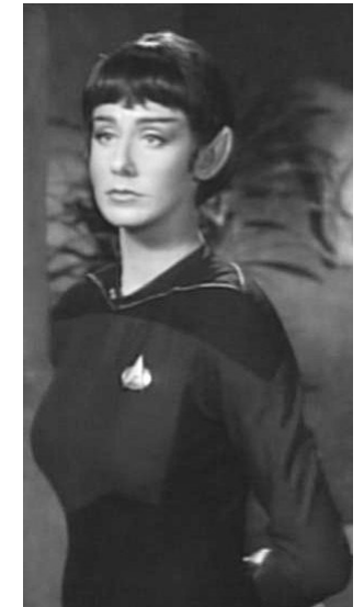
Un'ufficiale vulcaniana della Flotta Stellare ( "L'uomo schizoidé" - The Next Generation - 2° stagione)

È norma degli ufficiali tenere un diario di bordo se il proprio ruolo lo richiede ed eventualmente un diario personale.