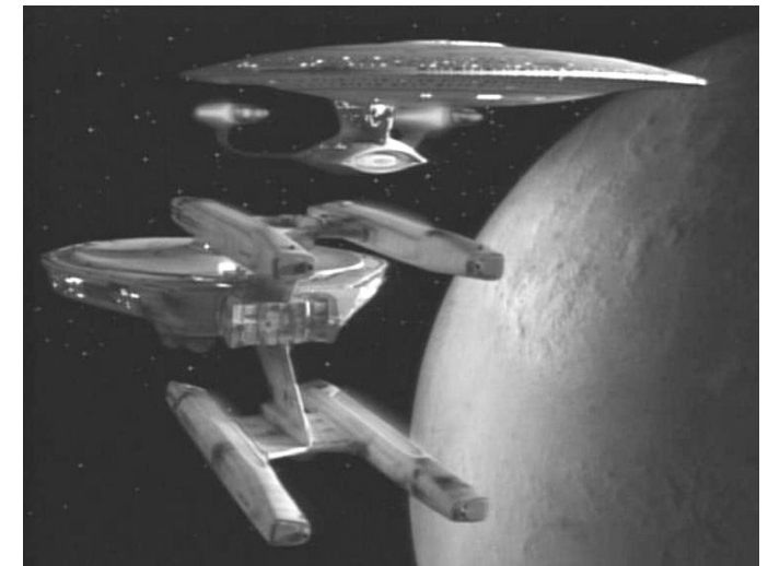
Navi della flotta stellare: la USS Enterprise di classe Galaxy e la USS Hataway di classe Constellation ("Una perfetta strategia" - The Next Generation - 2° stagione)

L'organismo più importante della Federazione è senza dubbio la Flotta Stellare , che comprende e coordina tutte le navi della Federazione. Tipicamente una nave della Flotta Stellare è legata ad una particolare razza, che di solito l'ha varata ed alla cui specie appartiene la stragrande maggioranza dei membri dell'equipaggio. Scambi temporanei e permanenti di ufficiali di ogni razza appartenente alla Federazione rappresentano comunque la quotidianità su una nave della Flotta Stellare.