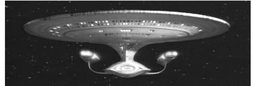
La USS Enterprise ( "Cospirazione" - The Next Generation - 1° stagione)

Il raggio traente è un fascio di energia che permette ad un'astronave di "catturarne" un'altra, tenendola ferma in una posizione o trascinandola. Può venire sfruttato per stabilizzare le navette per manovre particolari o per trainare una nave in avaria, ma generalmente è utilizzato per impedire la fuga ad un'astronave ostile. Per bloccare un vascello di discrete dimensioni può essere necessario lo sforzo combinato di più navi. Non si può usare il raggio traente su una nave che abbia gli scudi alzati.