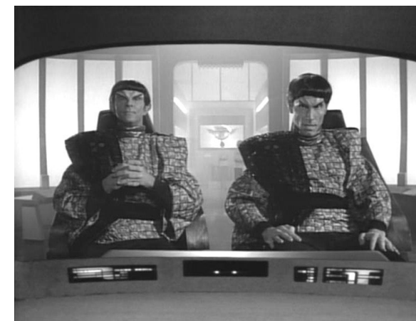
Due romulani a bordo di un falco da guerra ("La zona neutrale" - The Next Generation - 1° stagione)

I Romulani sono noti per essere intelligenti e spietati: in battaglia non lasciano prigionieri e ogni