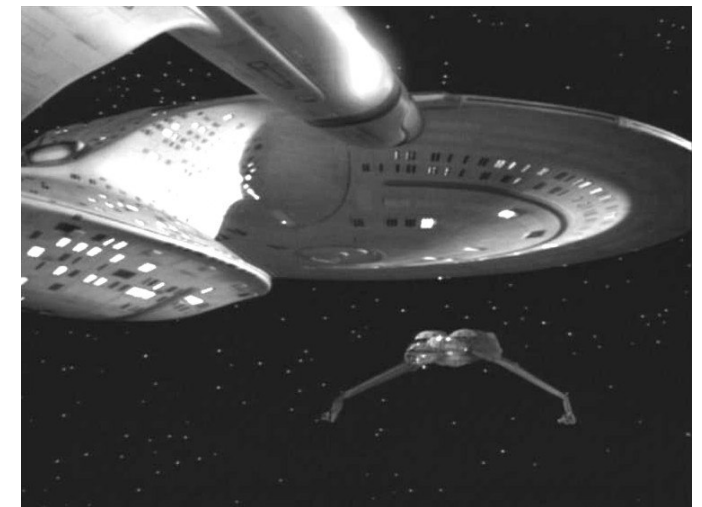
La USS Enterprise fronteggia uno sparviere Klingon (" Questione d'onore " - The Next Generation - 2° stagione)

I sensori esterni permettono di fornire informazioni su tutto lo spettro visivo (ossia come delle normali telecamere), sul rimanente campo delle onde elettromagnetiche, su onde